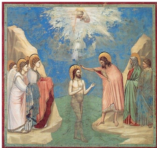
Giotto, Baptême du Christ, chapelle Scrovegni, Padoue, Italie

Réunion des membres du S.E.M. (Service Evangélique des Malades) vendredi 14 janvier à 15h à la salle paroissiale Notre-Dame de la Paix pour la préparation de la Messe des malades le 13 février prochain.