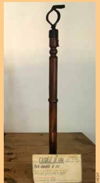
Collection privée, musée du lavedan, Aucun.

Mais surtout, par ce geste, nous reprenions l'alpha et l'oméga christique. Par le nombril tu es né à la vie, par le nombril tu en es sorti. L'alpha et l'oméga, le début et la fin, la boucle était bouclée.