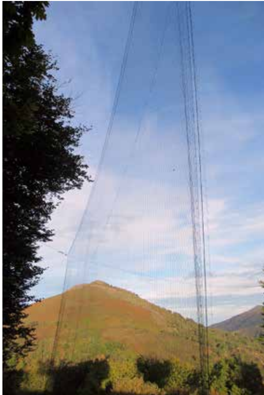
Les filets sont dressés, on n'attend plus que les palombes.

Trompées par ce leurre, les palombes plongent alors vers le fond du vallon pour lui échapper, réduisant ainsi l'espace entre elles et le sol, l'épervier menant ses attaques par en dessous.