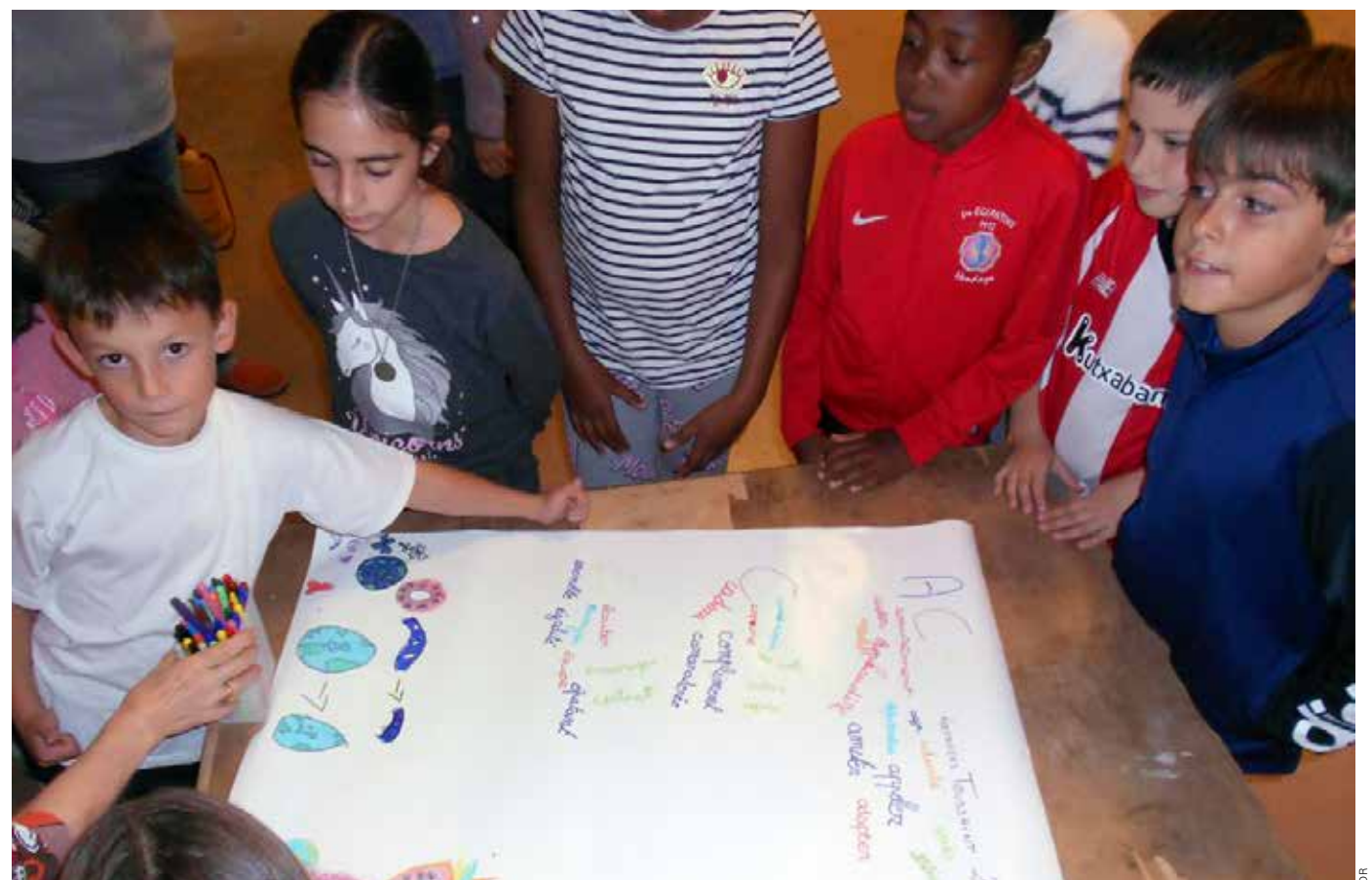
Ensemble autour du thème de l'année « Meilleur qu'hier ».

Pour tout contact, secrétariat presbytère Saint-Vincent 05 59 48 82 80