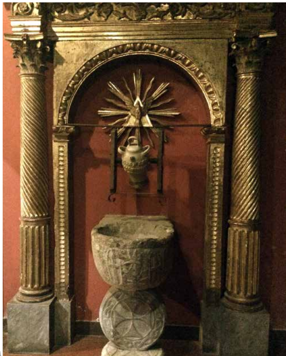
Les fonts baptismaux.

C'est au milieu du XII e siècle fondé au bord de la Bidassoa un hospice pour les pèlerins se rendant à Saint-Jacques de Compostelle et qu'est édifiée une chapelle. Cet endroit était un lieu de franchissement de la Bidassoa par le pont en bois du prieuré pour les pèlerins qui suivaient le chemin de la Côte. Le prieuré hôpital Saint-Jacques de Suberno, du nom de la famille qui possédait des domaines en ce lieu, se convertira ensuite en paroisse. Elle fut réunie à celle d'Hendaye en 1792. Le prieuré fut détruit lors des guerres de la Convention en 1793. Actuellement la rue Santiago et la rue Priorenica qui aboutit sur la Bidassoa font mémoire de ce passé et de cet emplacement.