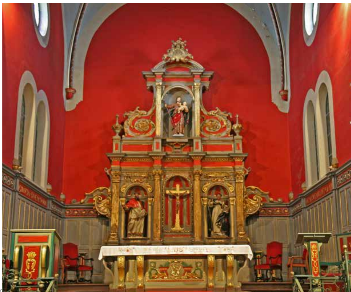
Le chœur de l'église.

Enfin tous les aménagements intérieurs incombant à la communauté paroissiale ont été tenus par l'ouverture d'une souscription exceptionnelle, la première en 1953 puis une nouvelle en 1967 et des appels de dons adressés au cours d'un dimanche d'été de 1968 à 1972. « La participation « massive » des paroissiens marquait leur constante adhésion à ces projets successifs non pas de destruction du passé mais plutôt de lui donner sa pleine valeur et le rendre plus authentique. » écrit l'abbé Lahet-Juzan