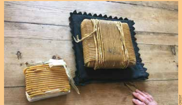
La cire de deuil. Planche de bois enrobée de cire d'abeilles.

Pour moitié, mes racines plongent dans une terre aux confins de la Bigorre, au pied de sommets « fiers et sublimes », à l'allure parfois himalayenne.