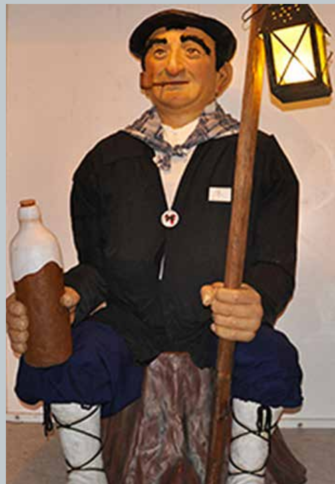
Olentzero est un homme glouton, buveur, dont l'apparence peu flatteuse suscite des moqueries.

Bien plus tard, lors de l'introduction du christianisme, la tradition a changé. Olentzero est devenu le charbonnier qui descend de la montagne en courant pour annoncer la bonne nouvelle de la naissance du Christ, lumière des hommes.