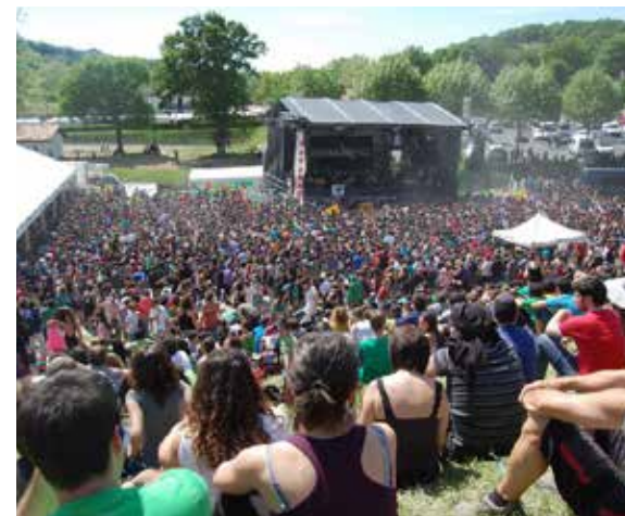
Herri Hurats à Saint-Pée-sur-Nivelle.