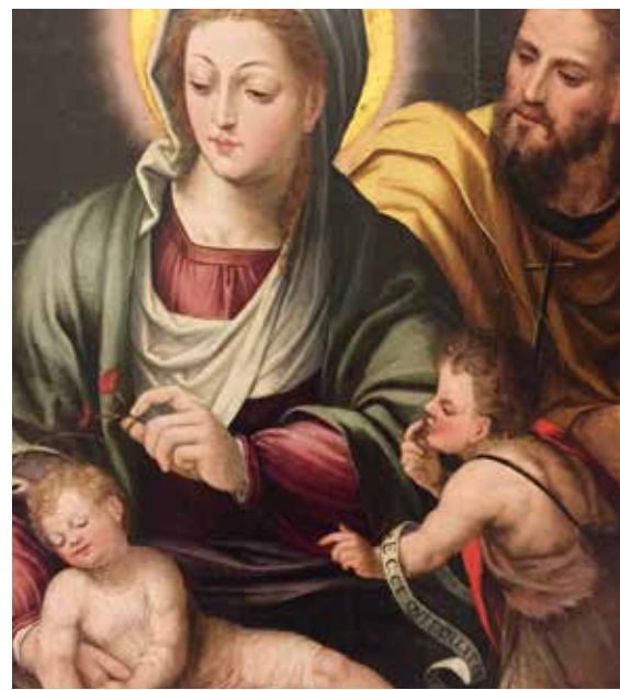
Sainte Famille de Pedro de Villegas, Musée des Beaux Arts Séville.

• Le sacrement de la réconciliation est peut-être l'un des plus importants. Il s'agit de s'autoriser à dire à haute voix et à être entendu par Dieu à travers l'oreille d'un homme ce qui est le plus inavouable en nous. Ce rite de passage demande courage, lucidité et abnégation. Il peut être pratiqué autant de fois qu'on le souhaite. Il est l'opportunité pour chacun de nous de prendre le temps de revenir sur nous-même. Il est un passage parce qu'il nous permet, par le pardon de Dieu, d'avoir la force