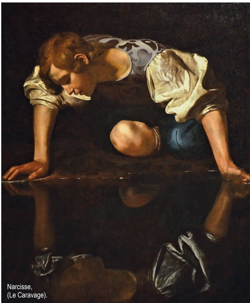
Narcisse, (Le Caravage).