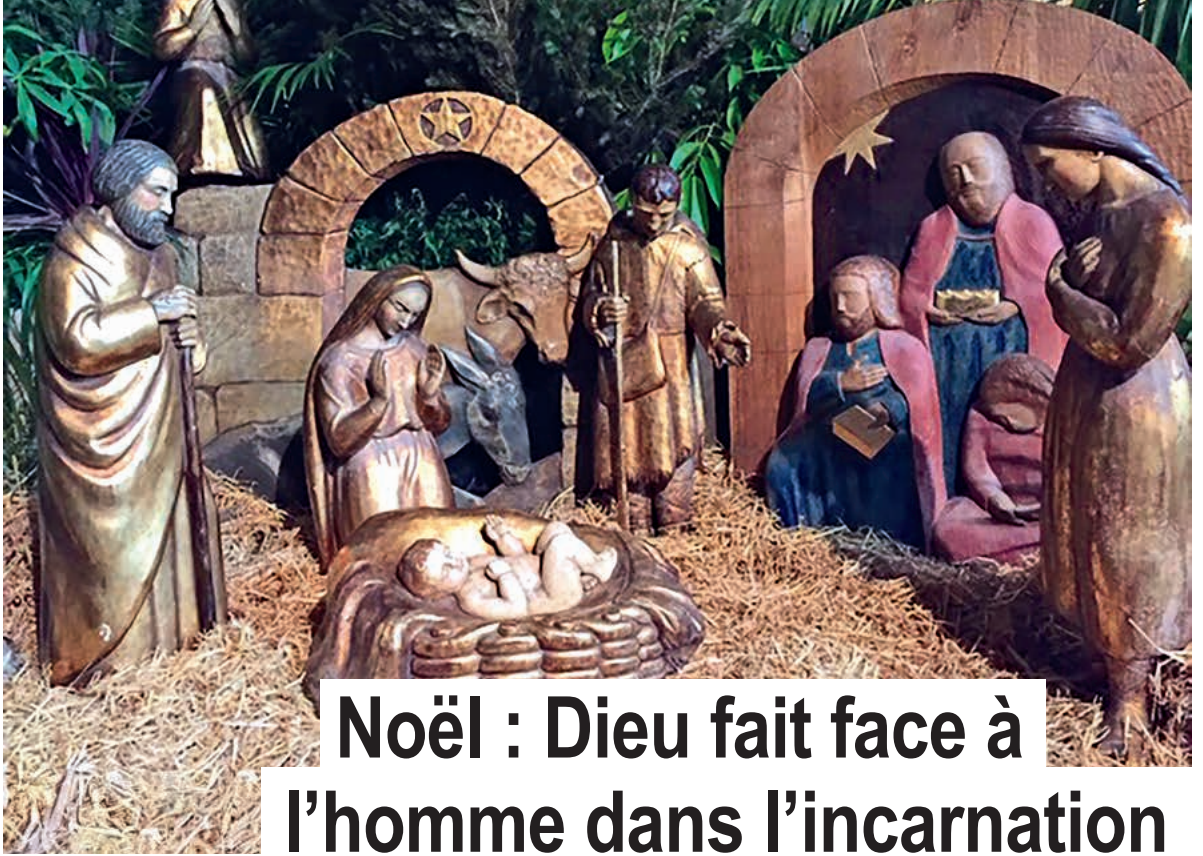
Crèche de Saint-Jean-de-Luz.